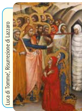
Luca di Tomme, Risurrezione di Lazzaro

Via B. Crespi, 30 - 20159 Milano - Tel. 02.345608.1 - Fax 02.345608.36 - Distr. Libreria Ancora Via Larga, 7 - 20122 Milano - Tel. 02.5830.7006 - abbonamenti@ancoralibri.it LA MESSA FESTIVA DEI FEDELI - Settimanale liturgico - N. 17 - Anno 35 - Direttore Responsabile G. Zini - Trib. Milano n. 344 del 6-7-1985 - Prezzo € 0,041 - Stampato su carta riciclata. Imprimatur: in Curia Arch. Mediolani die 4-11-2019, B. Marinoni Vic. ep.